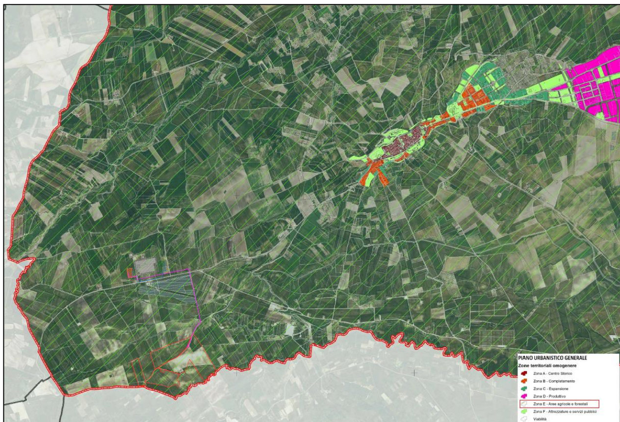
Figura 1 - "Piano urbanistico generale" - Allegata a PUG del Comune di Troia

Urbanisticamente tutte le aree oggetto d'intervento risultano essere tipizzate, nel vigente Piano Urbanistico Generale del Comune di Troia attualmente in vigore, come Zona Agricola "E" .